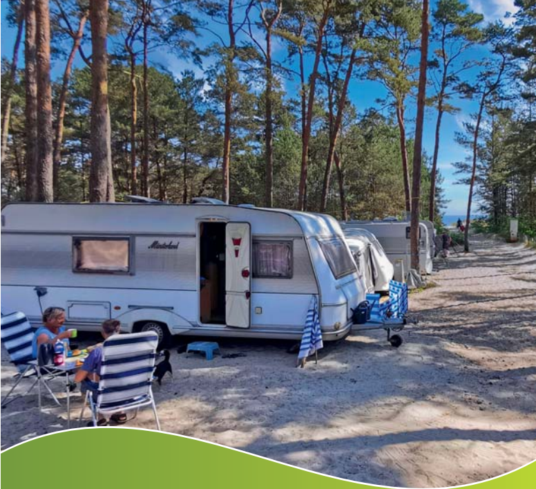
CAMPING IM KÜSTENWALD AM MEER